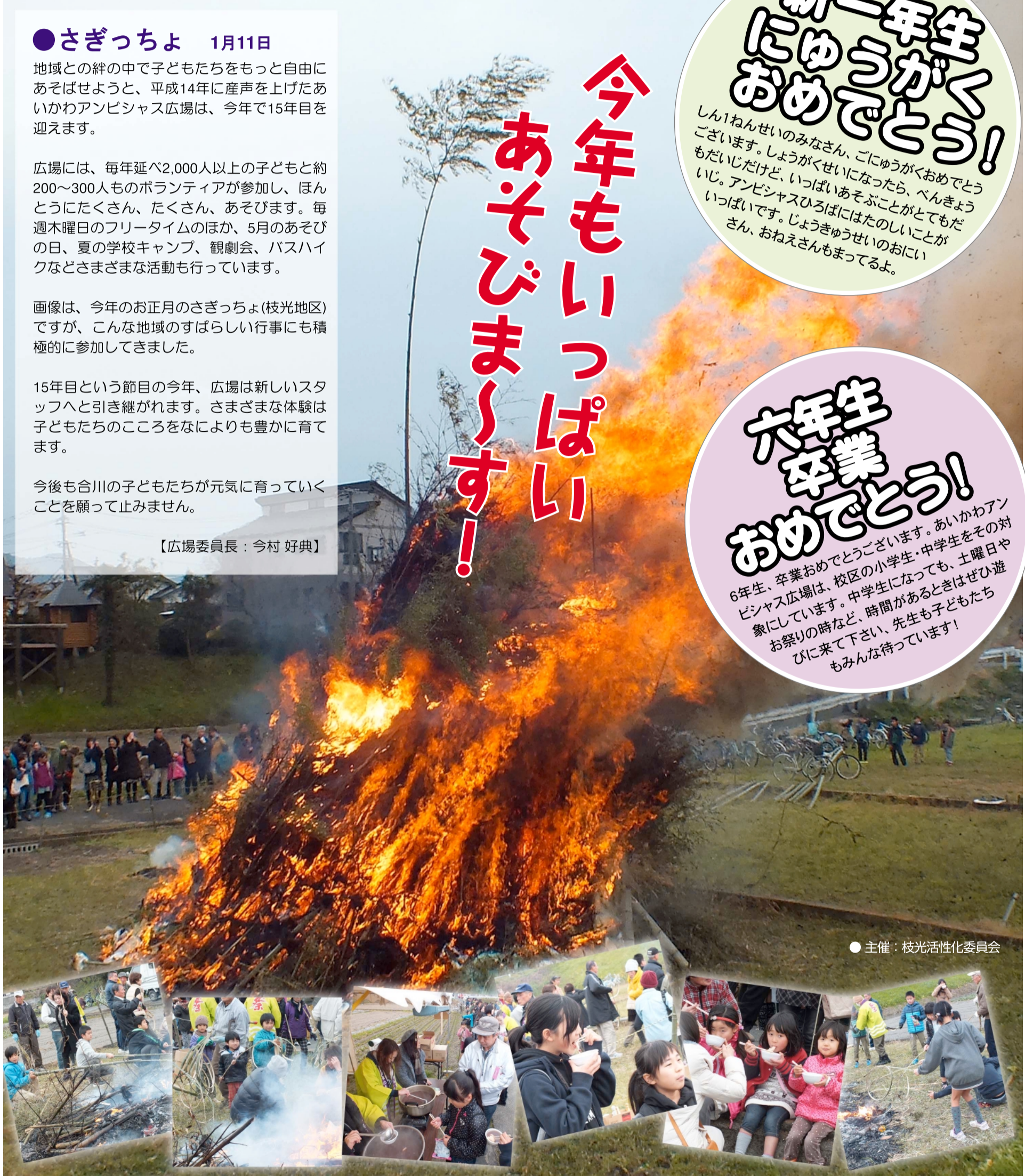
●主催：枝光活性化委員会