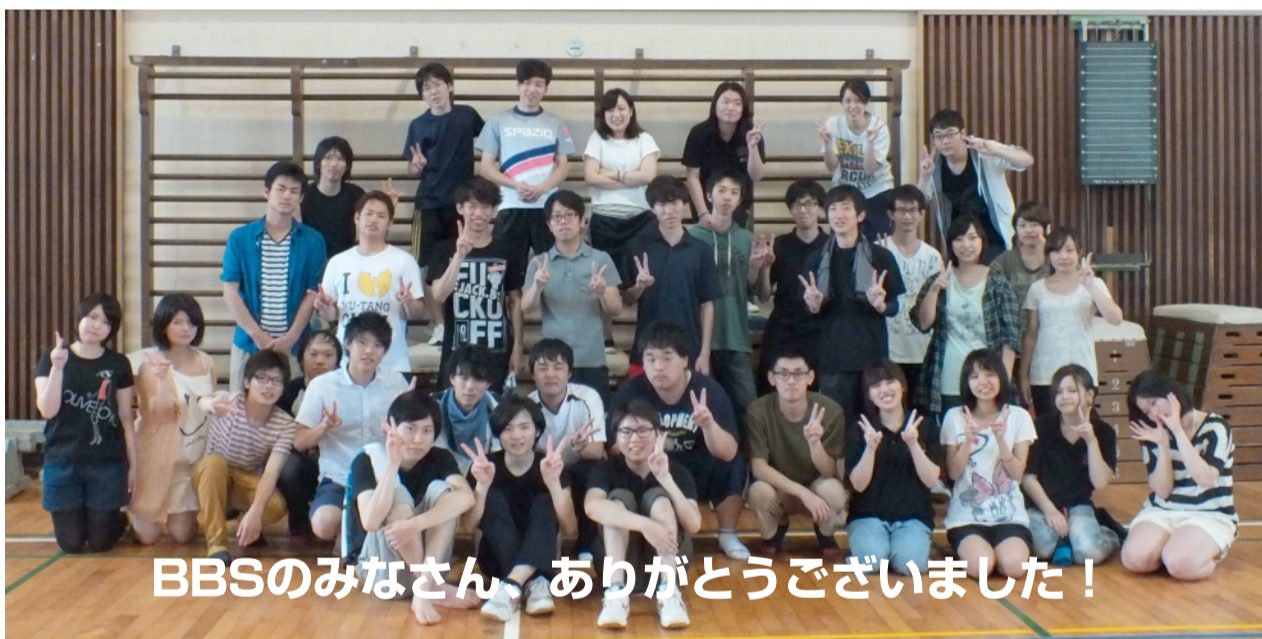
BBSのみなさん、ありがとうございました！

来年もOBという立場ではありますが、キャンプに参加したいと思いました。その時にはまた、次の担当に今年の反省点を改善していけるようにしていきたいです。そして、アンビシャスの方々や子どもたちのお父さんやお母さんなどに支えられ、美味しいご飯をいただいたり、お化け屋敷が成功したりしているので感謝の気持ちを持ちたいと思いました。