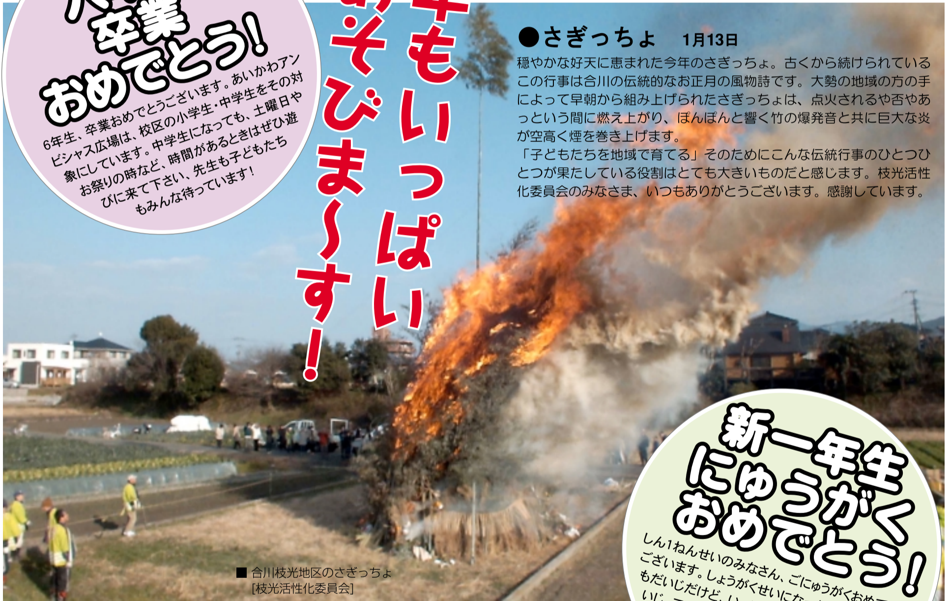
■合川枝光地区のさぎっちょ [枝光活性化委員会]

穏やかな好天に恵まれた今年のさぎっちょ。古くから続けられているこの行事は合川の伝統的なお正月の風物詩です。大勢の地域の方の手によって早朝から組み上げられたさぎっちょは、点火されるや否やあっという間に燃え上がり、ほんぽんと響く竹の爆発音と共に巨大な炎が空高く煙を巻き上げます。 「子どもたちを地域で育てる」そのためにこんな伝統行事のひとつひとつが果たしている役割はとても大きいものだと感じます。枝光活性化委員会のみなさま、いつもありがとうございます。感謝しています。