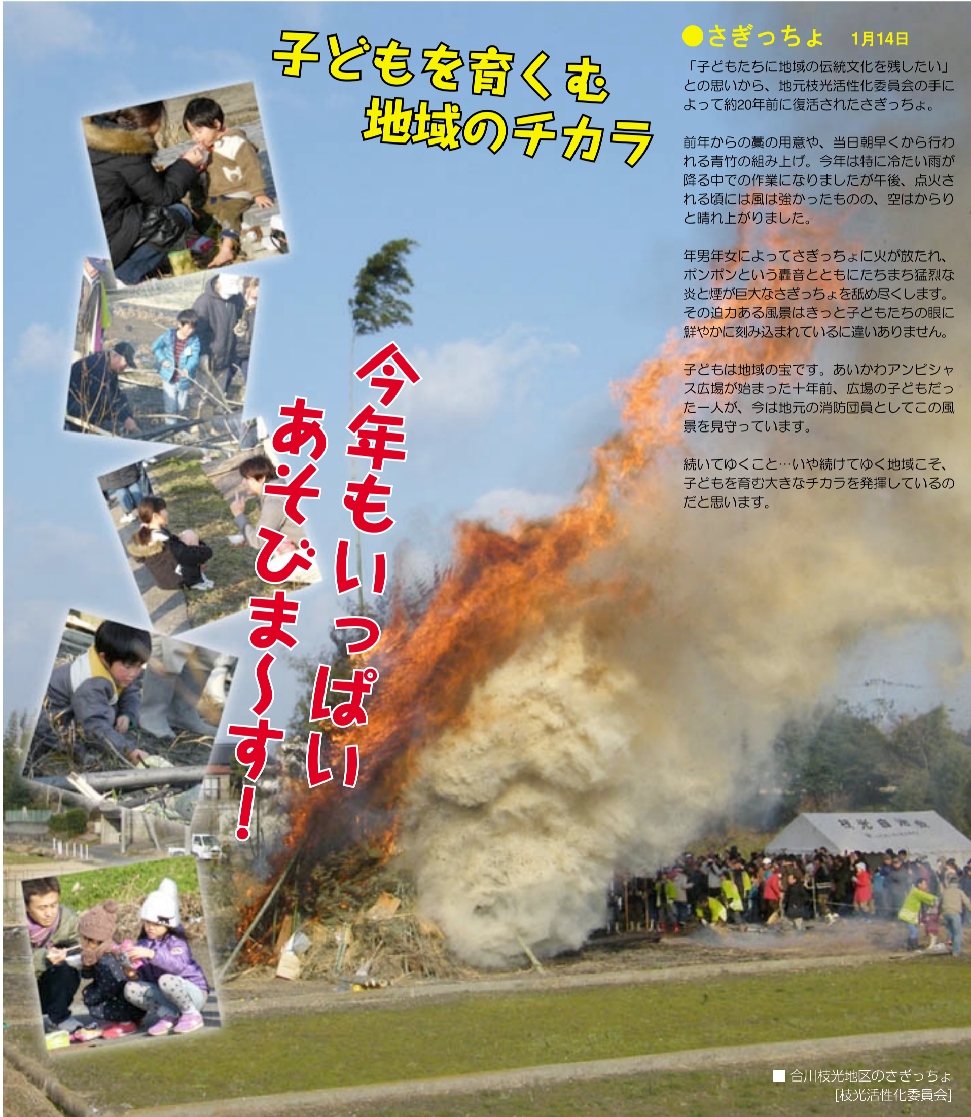
■ 合川枝光地区のさぎっちょ [枝光活性化委員会]