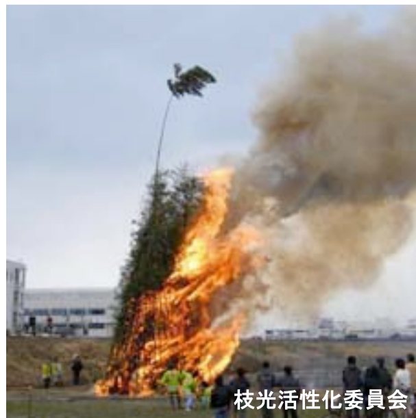
枝光活性化委員会